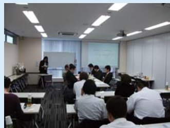
経営指針発表会の様子

とし、更なる発展を目指し日々精進してまいります。 今後とも宜しくお願いいたします。