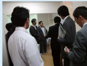
施設見学会の様子