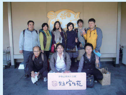
慰安旅行の様子 (ホテル前での集合写真)

『ものづくり』を通して、都市にメッセージを！～お客様の喜びが会社と社員の幸福をつくる～の経営理念をもとにお客様の発展のお手伝いをさせていただきますので、宜しくお願いいたします。