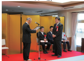
開所式での感謝状授与の様子