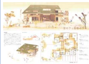
優秀賞「空の下と屋根の下」

来年度、再来年度と継続して開催をする予定です。ご家族やお知り合いに建築学生の方がお見えでしたら、ぜひ本コンペをお伝え頂けると幸いです。