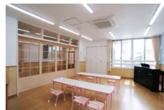
おうすだきしめ保育園 保育室

2017年2月と3月に名古屋市認可の保育園が2件竣工いたしました。新築物件と改修物件になります。おうすだきしめ保育園は木造2階建の新築で、白い外観と木を基調とした内部となっています。ポピンズナーサリースクール名東は既存の建物を保育園に改修した物件ですが、事業者様のカラーを取り入れることで、改修とは思えない素敵な施設になったと思います。内部は白を基調とし、家具の配置、設備の配置については事業者様、施工者様そしてユーエス計画研究所が互いに入念に打合せを行うことで、無事竣工へと導くことができました。これからも、お客様の喜んでいただけるような建物の創造に、一つでも多く携わっていただけるよう努力していきます。(中島)