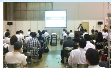
弊社繁野の講演の様子

昨年に引き続き今年も株式会社 高齢者住宅新聞社様が主催している高齢者住宅フェア2016in東京に7月27、28日の二日間、ブースを出展致しました。