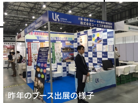
昨年のブース出展の様子