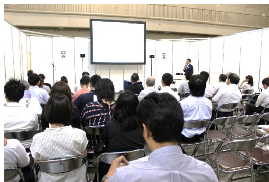
昨年のセミナーの様子

※招待券を同封させていただきましたので、ご来場の際は、 必ず招待券をご持参くださいませ。(招待券をお持ちでない場合、 入場料 5,000 円が必要です。)追加で招待券が必要な場合は、 弊社までご遠慮なくお申し付けください。