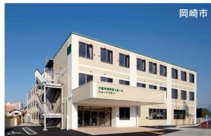
障がい者通所支援(放課後等デイサービス) 介護付き有料老人ホームに併設