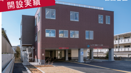
福祉サービス事業所 就労支援施設 定員50名 障がい者GH 定員7名