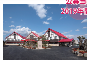
地域密着型特別養護老人ホーム29名 短期入所(ショートステイ) 29名 通所介護(デイサービス) 25名