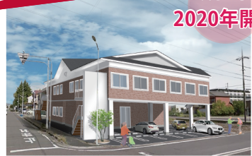
認知症対応型共同生活介護 27名