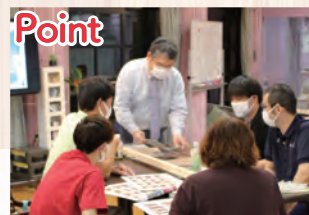
▲ 職員様のモチベーションを高める「施設改修ワークショップ」を開催