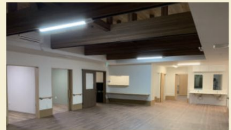
ゆいのかんたき綾瀬 内観